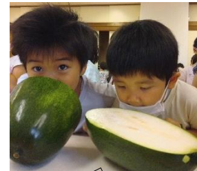
縦と横に切ったとうがんの匂いを嗅いでいる年長組の子どもたち。

そこで、園では、栄養士が考えたご飯の上にかけるふりかけに油揚げを入れたり、きんぴらごぼうを繊維にそって大きめに切ったりするなどした「噛み噛みメニュー」を提供しています。