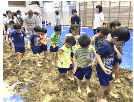
▲プログラム「粘土ワールドで遊ぼう」=いつもと感覚が違う2.5トンの粘土を足で踏んだり、手で握ったりして感触を楽しみました。

一方、人間が本来もっている感覚の一つ「触感」にスポットをあて、今回の親子プログラムが誕生しました。