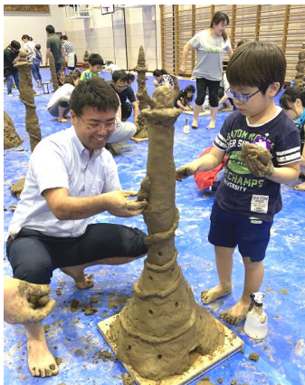
▲親子でイメージを伝え合い、自分だけのタワーを作ります。

○親子で協力し合う体験 併設校の第三日暮里小学校の体育館を舞台に、親子で粘土タワーを作りました。「マイ・スカイツリー」と題して創意工夫を凝らし、親子の対話を楽しみながら、見事なタワーが完成しました。