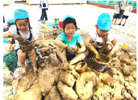
▲親子プログラムで使った粘土を日々の遊びの中にも取り入れています。

○親子で協力し合う体験 併設校の第三日暮里小学校の体育館を舞台に、親子で粘土タワーを作りました。「マイ・スカイツリー」と題して創意工夫を凝らし、親子の対話を楽しみながら、見事なタワーが完成しました。