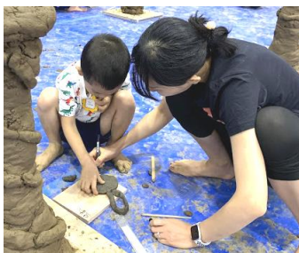
▲親子で思い出のメダルも作りました。

○芸術活動の日常化 親子プログラムで使った粘土を日々の遊びの中にも取り入れています。粘土の山に登ったり、泥団子を作ったり、ままごとをしたり、ダイナミックに思いっきり楽しんで遊んでいます。