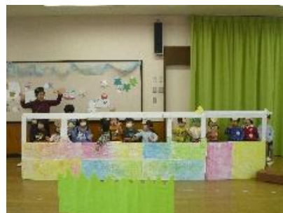
うさぎ組劇遊びの会

毎日の送り迎えや行事へのご参加を通して、園とご家庭が共に歩んできた一年でした。子供たちの成長と一緒に喜び合えたことは、私たち教職員にとって何よりの励みです。これからも、子供たち一人一人が自分の力を発揮できる充実した保育活動を行い、子供たちが安心して過ごせる環境づくりに努めてまいります。今後ともどうぞよろしくお願いいたします。