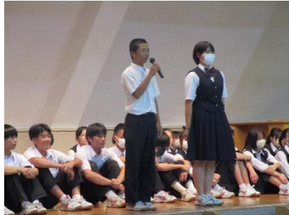
男女キャプテンからのあいさつ