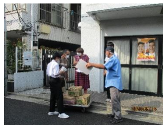
敬老ボランティア