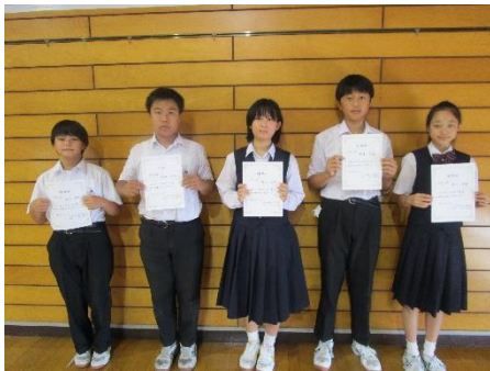
任命された役員の皆さん

9月25日(月)に新本部役員の任命式があり、新体制がスタートしました。選ばれた皆さん、よろしくお願いします。今後、それぞれの学級から選出された各種委員会により委員長が選出されることで、後期の中央議会がスタートします。このように四中では「間接民主制の仕組み」を基にして自治活動を行っています。次に掲載した「任命式に際しての校長先生のお話し」をよく読み、これまでの実績・活動を引き継ぎながら、四中の自治活動をさらに発展させていってくれることを期待しています。