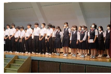
連合体育大会 壮行会