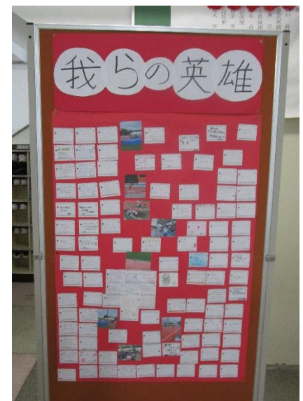
3年生のメッセージ