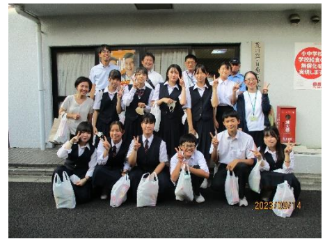
ボランティアに参加した皆さん

お手紙についても、全校から募ったボランティア生徒の皆さんが心を込めて書き上げ、封詰め作業を行いました。作業には、15名の生徒が参加してくれ、手紙を折る、封筒に詰める、のり付けする等、作業を上手に分担しながら積極的に取り組んでくれました。今回のように、中学生がその力を発揮して取り組んだことで少しでも地域の役に立てれば嬉しく思います。これからも機会があれば、こうした地域活動に協力させていただきたいと思ひます。