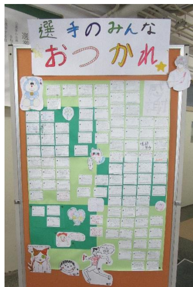
2年生のメッセージ