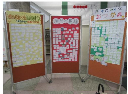
全学年からのメッセージ