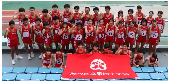
連合陸上大会 参加者のみなさん

9月22日(金)、荒川区立中学校連合体育大会が開催されました。本大会は長年、国立競技場が会場でしたが、建替工事を期に、平成26年度からは会場を移して実施してきました。会場は江戸川区立陸上競技場、今回は選手・係生徒に加え、保護者の参観の下で実施されました。