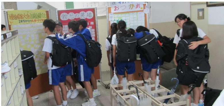
帰ってきて見学する選手たち