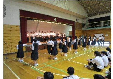
応援団によるエール