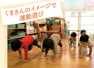
くまさんのイメージで運動遊び