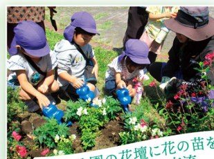
汐入公園の花壇に花の苗をいっしょに植えて交流