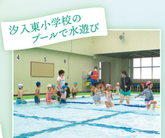
汐入東小学校のプールで水遊び