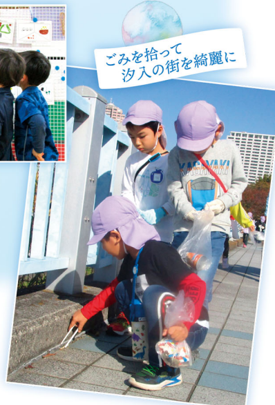
ゴミを拾って汐入の街を綺麗に