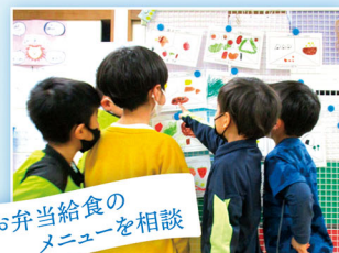
お弁当給食のメニューを相談