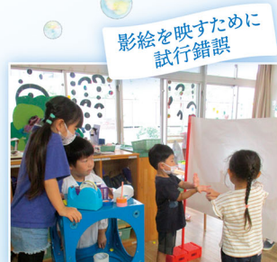
影絵を映すために試行錯誤