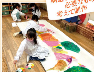
劇遊びの会で必要なものを考えて制作