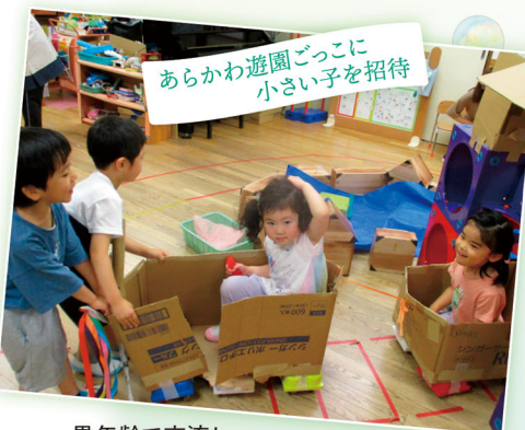
あらかわ遊園ごっこに小さい子を招待