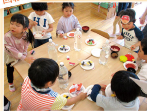
作ったものを使って回転ずしごっこ