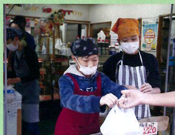
わくわく商人塾(あきんどじゅく)

読書月間等を設定し、お話ポケットや読み聞かせボランティアのご協力によって読書活動の充実を図っています。