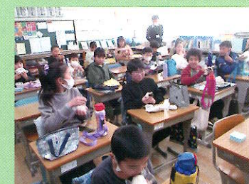
お弁当の日(おにぎりづくり)

お弁当の日(おにぎりづくり)等を実施し、児童自身が食事を作る活動を通して、食の大切さについて理解を深めさせ、感謝の心を育てます。