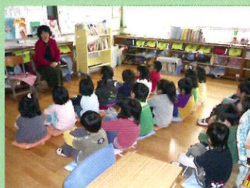
図書ボランティア