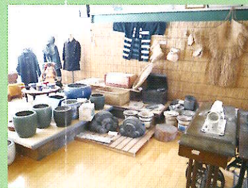
六日ミュージアム

儀式的行事では雅楽が演奏されます。「伝統・文化ノート」を活用し、全教育活動において伝統・文化理解教育に取り組めます。 また、掲示板や廊下、六日ミュージアムには、「浮世絵」「折り紙」「昔の道具」等が展示されています。