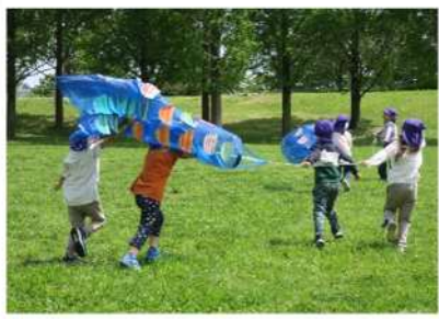
5歳児 手作りこいのぼりを泳がせよう