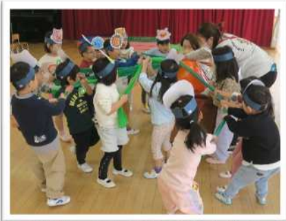
3歳児 劇あそびの会に向けて