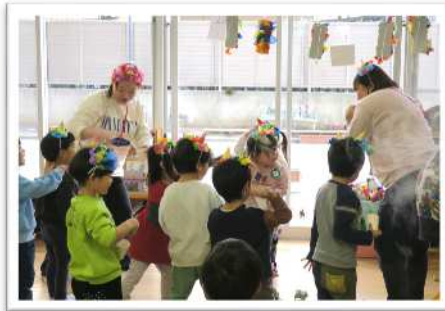
3歳児「おにはーそと！」