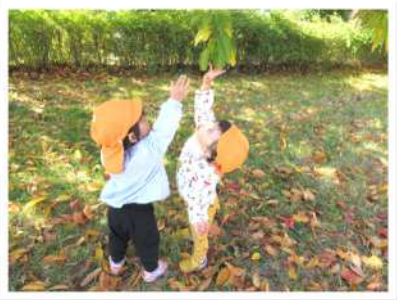
1 歳児 秋の暖かな日差しの中で