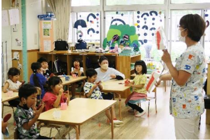
園歯科医による歯磨き指導