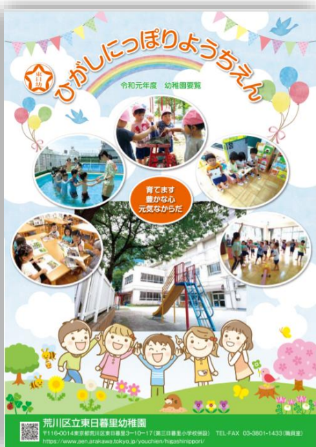
▲幼稚園が制作した幼稚園案内

なお、幼稚園で感染症が疑われる症状が見られた場合は、別室等で対応します。また、教職員等は、マスクやゴム手袋、フェイスシールドなどの感染症対策をとって対応します。