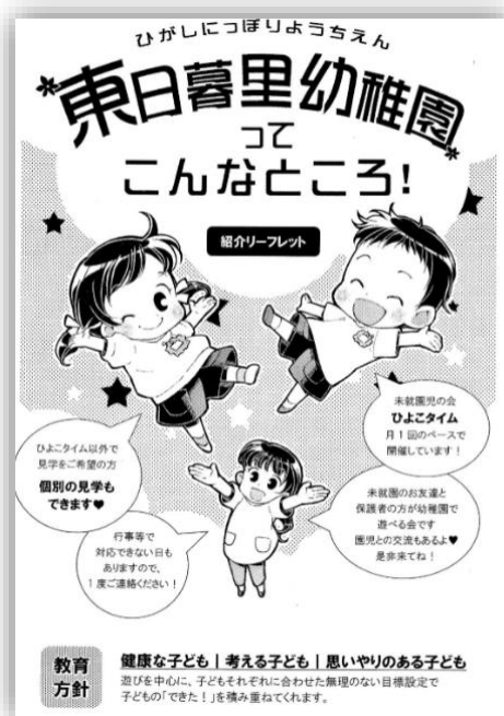
▲PTA が制作した幼稚園案内