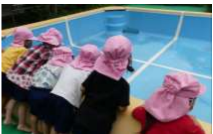
いるか組やりす組が入るプールの大きさにびっくり。 中をのぞいて「すご〜い！」と目を丸くしていました。

七夕飾り制作（染め紙） 折った障子紙を色水に浸して染めていきます。染めていく様子や色が混ざるのをじっくり見つめて何度も試して楽しめます。