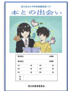
荒川小中学校推薦図書リスト 『本との出会い』

また、荒川区立図書館からは全校生徒へ『図書館員の太鼓ボン』という小冊子をいただきました。こちらは10代のみなさんにぜひ読んでほしい本が厳選されて紹介されています。ブックリストは、新しい本との出会いをサポートしてくれる心強い味方です。上手に活用して読みたい本を見つけみてください。