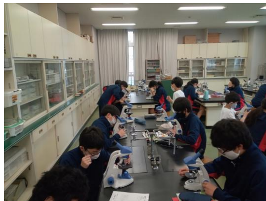
1年生の理科。顕微鏡の使い方の学習。 うまく調整できるとあるものが見えました。