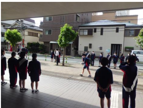
生徒会役員選挙に向けた選挙活動の様子

さて、本校、諏訪台中学校の守るべき「不易」は、「思いやりある行動を心がけること」「よく学ぶこと」「心身ともに健康であること」、そして「生活するこの地域に感謝し、大切にすること」です。これらを実現させるために、時には「流行」が必要になることでしょう。本部と各委員会、そして会員である生徒のみなさんが協力して、実りある生徒会運営を目指してほしいと思います。