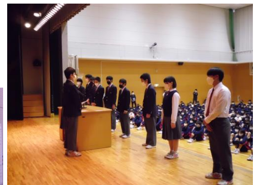
後期生徒会認証式の様子