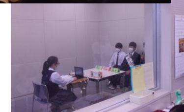
オンライン立会演説会