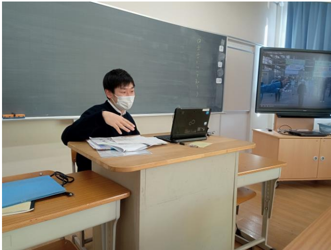
1年国語は方言の学習。 大阪弁のラジオ体操の映像を見ます。