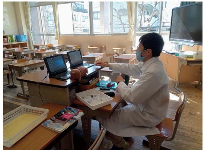
理科はオンラインでも白衣が基本(?)