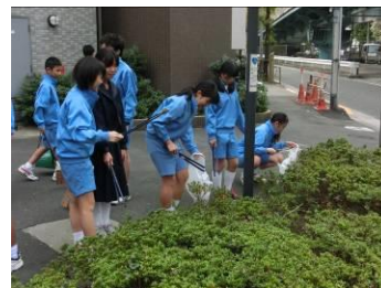
【植え込みの中も綺麗に】

また、平日にもかかわらず10名の保護者の方が参加してくださいました。ありがとうございました。