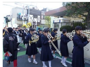
【吹奏楽部による演奏パレード】