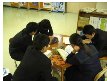
【職員室前は学習スペース】

11月21日22日は期末考査でした。期末考査前の1週間テスト週間となり、部活動は原則活動停止となります。この期間の放課後各学年とも放課後学習に取り組んでいます。生徒同士で互いに教え合うグループもあれば、各教科の先生に質問をたくさんしている生徒もいます。家庭学習も大切ですが、本校では互いに学び合うことも大切にしています。これらの学習を通して、一人一人に学習習慣が定着してくれることを願っています。