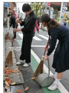
【落ち葉がいっぱいです】

落ち葉の季節となりました。環境委員会では毎日、学校周辺道路の清掃活動を行っています。学校の始業前の時間に、他の生徒より少し早く登校して清掃しています。急に寒くなり朝早い時間からの活動はたいへんですが、掃除をして道路がだんだんきれいになっていくといい気分になります。南千住がきれいな街になり、みんなが気持ちよく生活できるといいと思います。