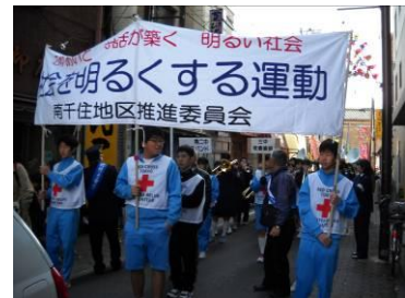
【先頭を歩くレスキュー部】

当日はとても寒い日でしたが、本校からは吹奏楽部とレスキュー部が参加しました。南千住をよりよい街にしていこうと熱い願いを込めて活動しました。