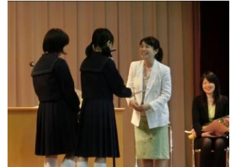
【お礼の手紙と花束の贈呈】

南二中を離れてみてあらためて南二中の素晴らしさに感動されていました。先生方の期待に応え、これからも素敵な南二中を築いていきましょう。