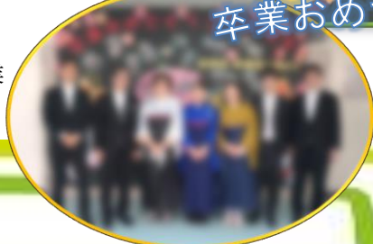
▲在校生からのメッセージ ▼卒業学年の先生方