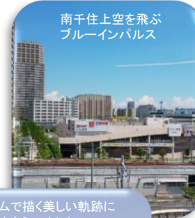
チームで描く美しい軌跡に 勇気をもらいました。

一人ひとりが ストレスに負けない強さ と人を思いやる 優しさを兼ね備えた『たくましい人』 でいてください。