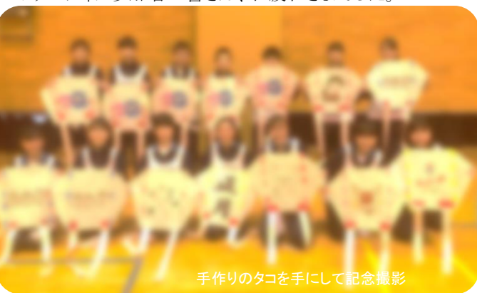
手作りのタコを手にして記念撮影