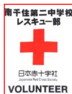
南千住二中のレスキュー部は色々な場面でボランティアとして大活躍!