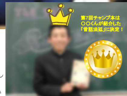
第7回チャンプ本は〇〇くんが紹介した「昔話法廷」に決定!