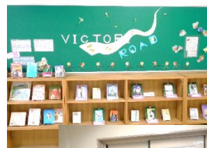
←図書室前には、3年生への応援メッセージが飾られています。