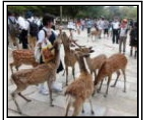
鹿に囲まれて 奈良公園

2日目のタクシー行動では、周辺部の見学をした班が多く、 その中でもなんとと言っても金閣寺。美しいその姿に改めて感動 しました。午後から奈良に入り、奈良公園・東大寺大仏殿を見 学し、ここでもその大きさに圧倒されました。また、鹿せんべ いを手にたくさんの鹿に囲まれて、可愛いやら怖いやら、大騒 ぎでした。