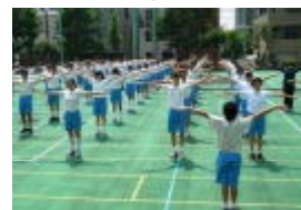
ラジオ体操の練習

体育の授業では、ラジオ体操や全級リレーなどの練習、さらに学年の練習も始まっています。また、吹奏楽部は当日演奏予定の「校歌」の練習に連日、熱心に取り組んでいます。今年も趣向を凝らした学年種目も考えられています。どうぞお楽しみに。