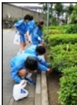
植え込みの中もきれいに

出発式では、JRC委員長が「街をきれいにしましょう」と呼びかけ、出発しました。1年生は南千住七丁目、2年生は五丁目、3年生は六丁目を中心に行いました。南千住の街はきれいに保たれていますが、目につきにくい道路の植え込みの中やちょっとした物陰にはゴミがたくさん落ちていました。特に目立ったのがタバコの吸い殻と空き缶・ペットボトルなどでした。中には空き缶の中に吸い殻が入っていて捨てられているものもありました。中に虫が大量に入り込んでいるものもあり、きれいに洗うのも一苦労でした。最後に全校生徒が拾ったゴミをJRC委員が中心になりまとめると、大きなゴミ袋がいくつもいっぱいになりました。