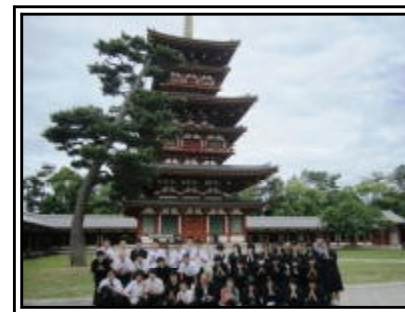
3日目 薬師寺三重の等をバックに

1日はクラス単位での移動です。クラスが一緒に疲れ も忘れて盛り上がりました。薬師寺のお坊さんのお話 が印象に残りました。法隆寺のエンタシスの柱も夢違 い観音・玉虫厨子もしっかり見学できました。