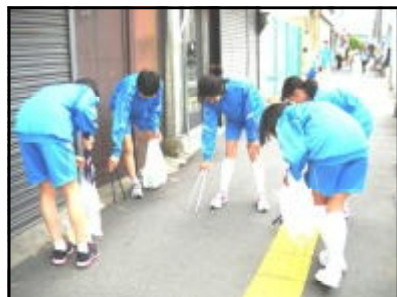
小さなゴミもみんなで拾う

5月25日(土)は、学校公開日でした。この日の1・2校時にあたる時間帯に地域清掃を行いました。地域清掃は本校が全校加盟しているJRC(青少年赤十字)活動の一環として、昨年度から本格的に取り組んでいるものです。全校生徒が地域に出て、ゴミ拾いなどの清掃活動を行いました。