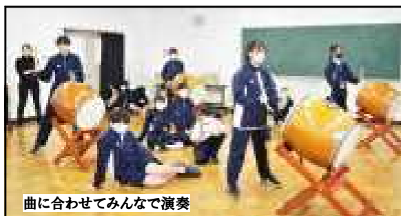
曲に合わせてみんなで演奏