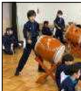
だんだん楽しくなってきた

楽しい音楽の時間でした。講師を務めていただいた天王太鼓の皆さん、ありがとうございました。