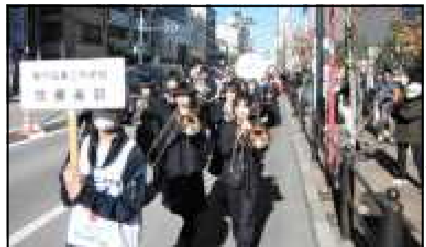
プラカードも担当