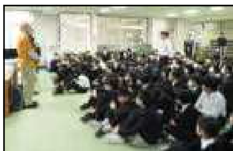
全体会で先生方にお礼

会の終わりには1年生の代表がお礼の言葉を述べ、先生方に感謝の拍手が送られました。先生方からのお話を伺い、さまざまな国の習慣や考え方の違いを理解し、自分たちとのかかわり方で大切なことが分かってきたように感じられました。また、習慣や生活が違って、生きていく思いは同じであることも理解できました。4人の先生方、ありがとうございました。