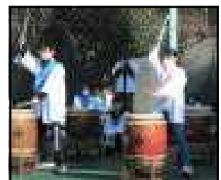
会を盛り上げた天王太鼓