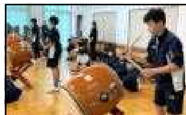
なかなかむずかしい