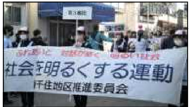
横断幕を持って行進

11:00からはいよいよパレードの開始です。参加した吹奏楽部員は21名。南千住二中から荒川一中までの道のりを荒川区歌の「あらかわ、そして未来へ」や「聖者の行進」「負けないで」を演奏しながら歩きました。力強く、リズムにのった演奏は沿道の人々の目をひいていました。そして、パレードの先頭で横断幕を持ち、プラカードを掲げているのは、レスキュー部とサッカー部を合わせて29名の部員たちでした。パレードだけでなく、会場の設置や撤収などのお手伝いでも大活躍でした。会を主催した方々からもたくさんのお褒めの言葉をいただきました。