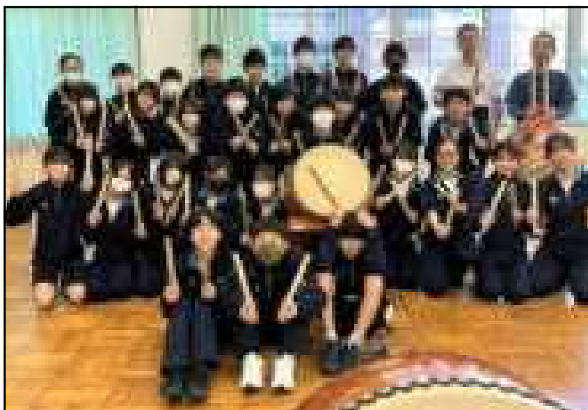
先生と一緒に記念撮影