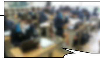
朝学習の様子。 頑張っています!

第3回: 3月 1日(火)~3月 9日(水) ... 重点教科 国語 ※1・2年生のみ