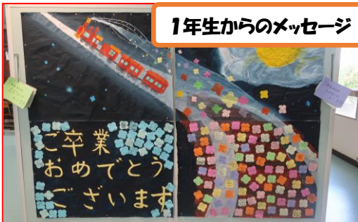
1年生からのメッセージ

今年も行事が縮小されてしまったり、部活動も満足に行うことができなかったりと他学年との活動が著しく制限されてしまいました。それを受け、今年も「ビデオメッセージ」は1, 2年生からのメッセージだけでなく、旧本部役員にも協力してもらい、3年生からのメッセージも含まれたビデオとなりました。作成には旧本部役員である〇〇〇さんが携わりました。3送会後には1, 2年生からのメッセージボードも2階ホールに展示されました。協力したみなさんお疲れ様でした!