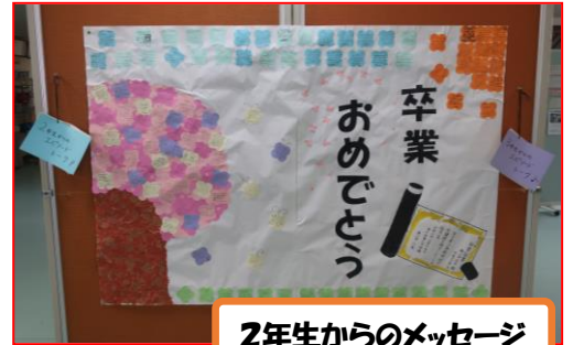
2年生からのメッセージ

3月16日(火)、現生徒会本部役員が主催して3年生を送る会を開いてくれました。今年も例年のようにアリーナで行うことができないため、放送を使ってラジオを模しての3送会でした。コーナーは「1, 2年生から3年生へのメッセージ」「3年生から1, 2年生へのメッセージ」「ビデオメッセージ」などでした。その中ではこの学年が霜月祭で合唱した『たいせつなもの』や『地球の鼓動』といった曲も流されていました。懐かしい2曲で1, 2年生のころを思い出した人も多かったのではないのでしょうか。また、ラジオならではの流れでゲストに〇〇〇〇さんや〇〇〇〇さんが登場し、1, 2年生へのメッセージや、過去のエピソードなどを話してくれました。