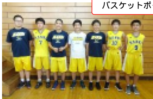
バスケットボール部

前号で掲載しきれなかった運動部の写真を掲載します！ 文化部でまだ活動が残っている人たちは最後の発表の場にむけて練習を続けてください！