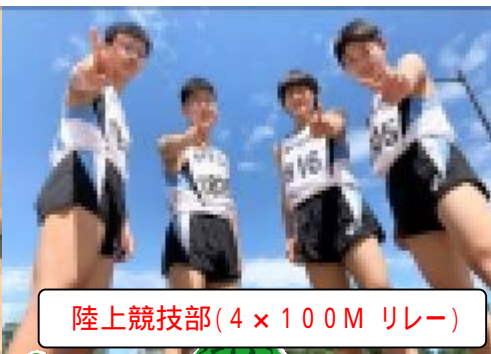
陸上競技部(4×100M リレー)