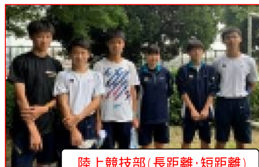
陸上競技部(長距離・短距離)

短い夏休みが明けました。有意義な夏休みを過ごすことができましたでしょうか。運動部の多くが夏休み中に最後の公式試合が行われ、3年間の成果を発揮しました。運動部の皆さん、最後までお疲れ様でした。これから始まる2学期は例年より長いものとなります。その中で、大霜月祭が10月末に予定されています。例年通りには運動会も霜月祭もできません。できる形で取り組むこととなりますが、心に残る行事にしてほしいと思っています。また、朗読部や吹奏楽部にとっては最後の発表の場となると思います。3年間の努力を発表できるように練習に励んでください。行事とあわせて、進路に向けても準備を進めていかなければなりません。到達度テストが9月、10月、11月と2学期に3回予定されています。最初の到達度テストは9月1日です。下に範囲を記載していますので、よく見て、学習しておきましょう。これらの到達度テストが皆さんの進路を決める重要な資料の一つとなります。そして、10月に中間テスト、11月に期末テストがあります。これらのテストももちろん、内申に関わるテストということで進路に向けて重要なものです。それらの結果を踏まえながら11月、12月の三者面談で進路を選択していきます。行事に進路に忙しく長い2学期となりますが学年一丸となって乗り越えて