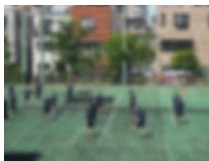
◆運動会選手決めや体育での練習などの様子◆