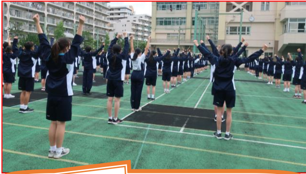
ラジオ体操は唯一全校生徒で行う種目です。

今週末、いよいよ運動会が控えています。先週はあいにくの雨模様で外での練習をすることができない中、アリーナで学年練習を行いました。まずは、ラジオ体操の練習に時間をかけて取り組みました。南千住第二中学校の運動会ではラジオ体操はただの準備運動ではなく、立派な演技種目です。腕の高さやジャンプのタイミングなどをそろえることで格好いい演技になります。ひとりひとりが意識することで全員の動きをそろえていきましょう。今週は学年種目と全員リレーの練習も行います。1年生の学年種目は「4輪ピック」に決まりました。この競技はフィールド内に