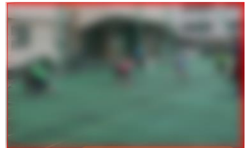
全員リレーの練習模様

青組 … 1年1組 ・ 2年2組 ・ 3年2組 赤組 … 1年2組 ・ 2年1組 ・ 3年3組 黄組 … 1年3組 ・ 2年3組 ・ 3年1組 緑組 … 1年4組 ・ 2年4組 ・ 3年4組