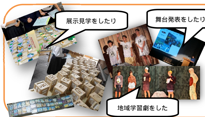
展示見学をしたり