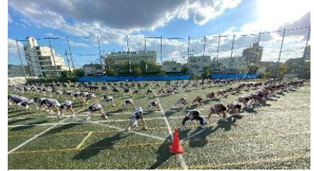
今年度の運動会より【3学年】

1月7日に、東京都の新型コロナウイルス新規感染者数が2447名との発表があり、緊急事態宣言再発出になりました。第2学期終業式では888名の感染者に驚きましたが、終業式や大晦日の数字は、ここ数日では当たり前の数字になってきています。