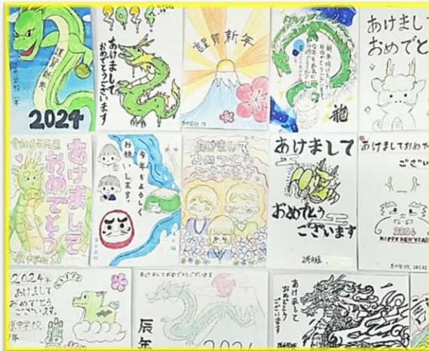
作成した年賀状の一部です。

年賀状を書いている間に、名前も知らない人なのにだんだん親しみがわいてきて、年賀状が届いて喜んでもらえるといいなと思いました。年賀状を送るときの嬉しさを実感しました。(世代間交流事業「年賀状作り」に参加した2年男子)