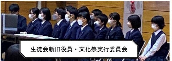
生徒会新旧役員・文化祭実行委員会

どの発表も素晴らしかったです。よく練習しました。この頑張りを自信にさらに成長することを願っています。