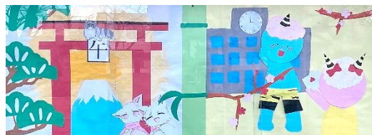
1月の美術部の作品「今年は丙午」

さて、3日は「節分」です。節分とは文字通り「季節を分ける」節目を指します。昔から、季節の変わり目には邪気が入りやすいと考えられ、それを追い払うために「鬼は外、福は内」と豆をまく習慣が生まれました。