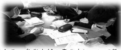
↑3年生。参考文献の書き方について教え合う姿も。