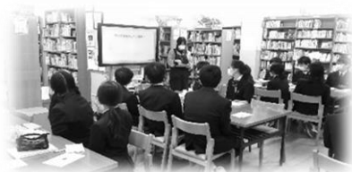
↑1年生。利用方法について聞いた後は、本探しのゲームをしました。

どれも本を読むうえで、また調べ学習をするうえで大切なことです。今後も、学校図書館でさまざまな知識を身に付けましょう！