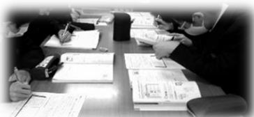
↑2年生。教科書を用いながら引用しました。