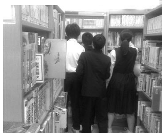
奥もあやしいぞ・・・