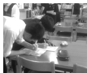
やった！あったぞー！