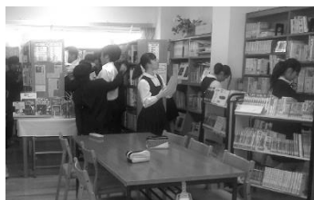
こっちの方かな・・・