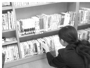
この間にあるかも・・・