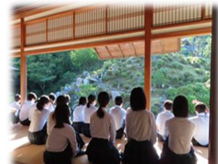
【3日目朝】眠い目をこすりつつ宿(智積院会館)の庭園を鑑賞