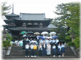
【1日目】雨の法隆寺で記念撮影

「奈良・京都の歴史を学び、仲間との絆を深めよう」のスローガンのもと、自分たちで計画を立て、協力することの大変さを実感する旅でした。「将来また奈良・京都を訪れたい」という声も多数聞かれました。