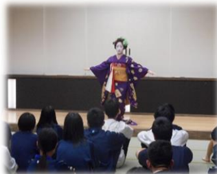
【2日目夜】15歳でこの道に入ることを選んだ舞妓さんの優雅な舞