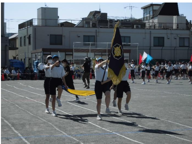
生徒会の入場行進 堂々とした行進で立派でした