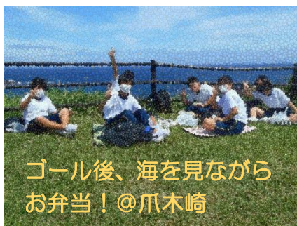
ゴール後、海を見ながらお弁当! @爪木崎

午後には外浦海岸でビーチドッジボール大会です。2日目も晴天に恵まれたため、この午前、午後ですっかり日焼けをしました。