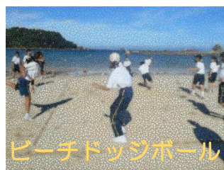
ビーチドッジボール