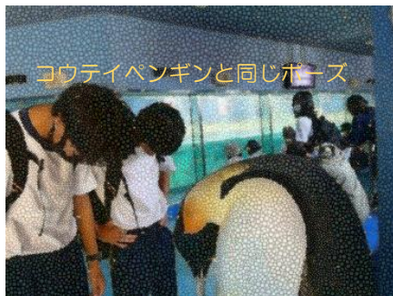
コウテイペンギンと同じポーズ

1年生に続き、2年生が9月12日(月)~14日(水)まで、下田移動教室に行ってきました。こちらは天候にも恵まれた3日間で、予定通りの行程を実施することができました。