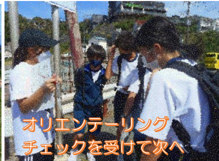
オリエンテーリングチェックを受けて次へ