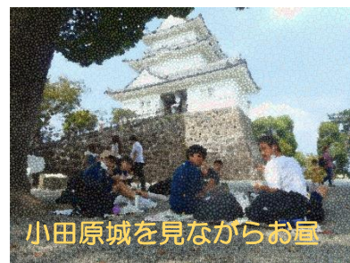
小田原城を見ながらお昼

3日目は伊東でお土産を購入。その後小田原城に立ち寄り、好天の中、お弁当を食べたり、侍館に立ち寄るなど歴史を感じることができました。