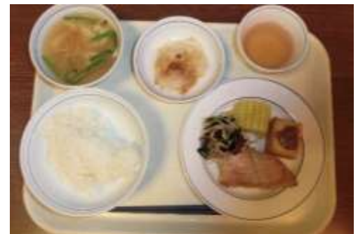
下田名物！ 金目鯛の照り焼き

夕食は下田名物・金目鯛の照り焼きでした。号令は 〇〇〇〇さん、〇〇〇〇さん 。おかわりをして、もりもり食べました。