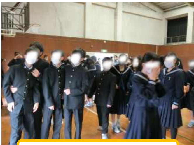
クラス分けの巻紙に一喜一憂！！

どの顔も緊張と笑顔でいっぱいでした。新しいクラスの発表にみんな一喜一憂です。クラス替えにより、嬉しい気持ちや、残念な気持ちを抱えながら新しい仲間と始業式を迎えましたが、みんなの心の成長と前向きな姿勢のおかげで、スムーズに式が進みました。話を聞く態度も立派で、先輩になったなと感じられました。始業式後、男子はすぐに1年生用の机を2階から4階に運びました。その後の新しいクラスでの学活もみんな、とても落ち着いて明るい表情だったので、先生方はひと安心しました。学活後すぐに入学式の準備という慌ただしい時程でしたが、みんなしっかり活動できました。特にみんなの働いている姿は、「さすが2年生！！」と感じられました。