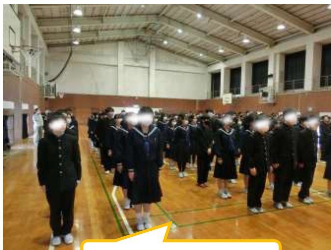
新しいクラスで整列