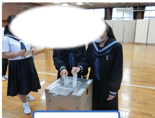
投票箱に投函します。

1年生の皆さんには、候補者が「たった3分の演説にどれくらいの時間をかけたのか」ということを考えてほしいです。名前入りのたすきの準備やポスター作り、原稿作りなど、立候補者はたくさんの時間を使って学校のために貢献しようとしていました。この熱い思いに皆さんは、応える必要があります。それは、自分たちが投票して選んだからです。そんな生徒会役員さんのために、そして学校のために「何ができるのか?」「何をしなければならないのか?」を考え、行動していかなければなりません。各クラスでは、後期の各種委員会や係も決まりました。皆さんのこれからの取り組みに期待します。