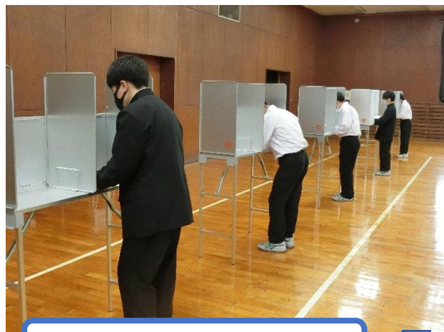
記載台で投票用紙に記入します。