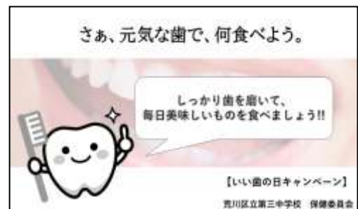
<いい歯の日 ポスター>