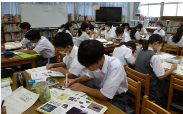
この鉱物は面白いな

図書館にある本を見比べて表紙（装丁）の書体の違いについて考察しました。その後、発表して班のみんなと共有します。