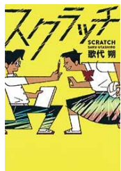
『スクラッチ』 歌代 朔／著 あかね書房