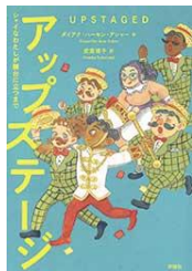
『アップステージ』 ダイアナ・ハーモン・アシャー／著 評論社