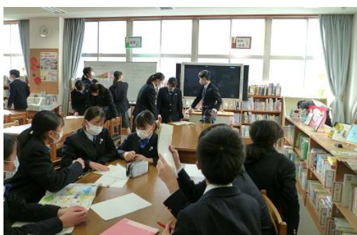
答えはスタンプ用紙の裏に書いて・・・

図書委員会主催の読書週間のイベント「あらすじクイズ」。61人もの皆さんが参加してくれました！一週目に每日一問ずつクイズが掲示されるのにあわせて、来館者も増え「もっとみんなに図書館を利用してほしい」という図書委員の願いも叶いました。「楽しいイベントを続けてください」という卒業した図書委員のみなさんの声を受け継いだイベント。図書委員のがんばりで、今年も楽しいものになりました！