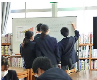
え～と、あ！これは・・・！