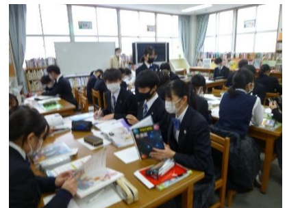
お、いい感じにまとまってきた