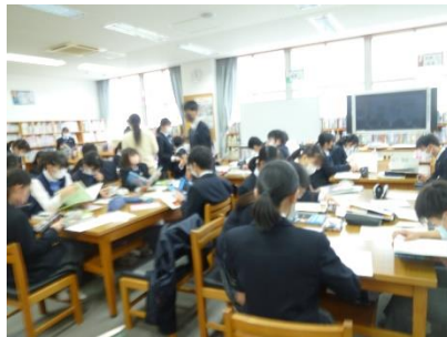
この本で調べよう！