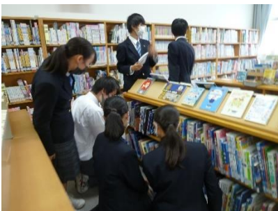
テーマをなににするかが迷う～

「運動とエネルギー」「宇宙」を各自で掘り下げ、深める学習です。切り口が独特でも理科学的な視点があれば大丈夫！先生をうならせる視点と、ビジュアルの美しさもポイントです。