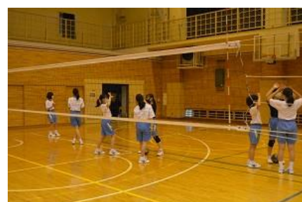
バレー部体験入学

ただし、2年生の下田移動教室が延期となったように、昨年度同様、今後の状況でどのように予定が変更になるか