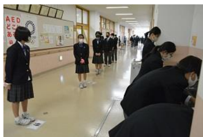
配膳前の手洗い(2年廊下)

この間、各学級では学級目標をたて、学級組織(専門委員・係決め)をつくり、今年度の給食の配膳・片付け方法や清掃の仕方を学びすぐに開始