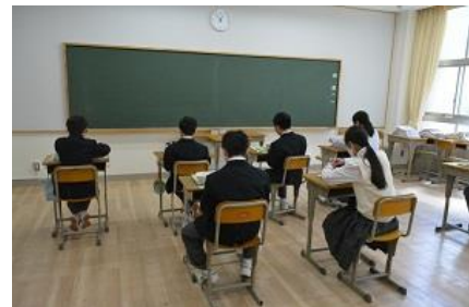
食事中(三組) <本校舎1階特別活動室>

概ね、2週目では、教科担当の教員から、今年度の授業の進め方について説明を聞くと同時に、受け方の留意点、評価・評定の出し方の説明、いわゆるガイダンスを受け、早速授業に入り始めました。放課後には、1年生の部活動体験も開始されると同時に、1年生では三者面談を行いました。