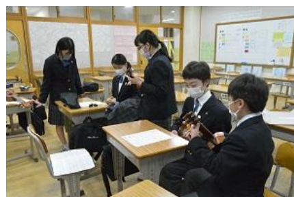
ウクレレ部体験入学