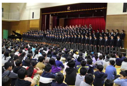
【学年合唱：大地讃頌】

今年の3年生は、歴代で最も人数の多い学年で190名近い生徒が汐入小学校の舞台に立ち、学年合唱曲「大地讃頌」が小学校の体育館に響き渡りました。たくましく成長した卒業生の姿を小学校の先生方も目を細めて見ていらっしゃいました。