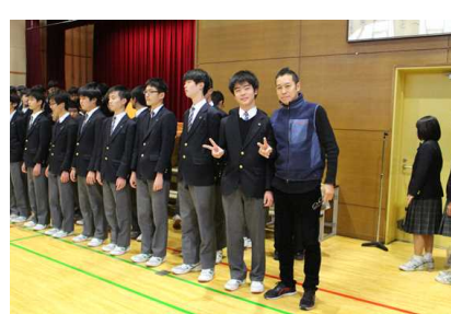
【小学校の先生と再会】