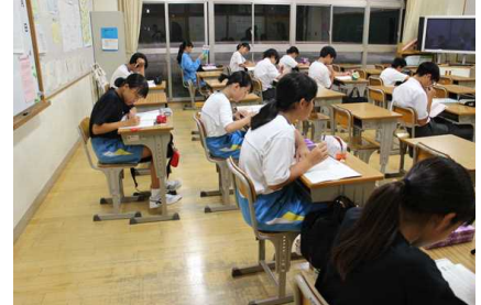
【小さな気づきは大きな前進】